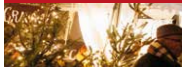
Place Fernand Lombard

Des produits du terroir, des idées cadeaux, le son des animations et de bonnes odeurs de crêpes ! Voilà le programme des 3 jours du marché de Noël. La grande arche décorative fera son retour devant la verrière, et 30 stands seront alignés place Fernand Lombard jusqu'à la rue Lifffran.